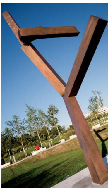
La escultura y su sombra