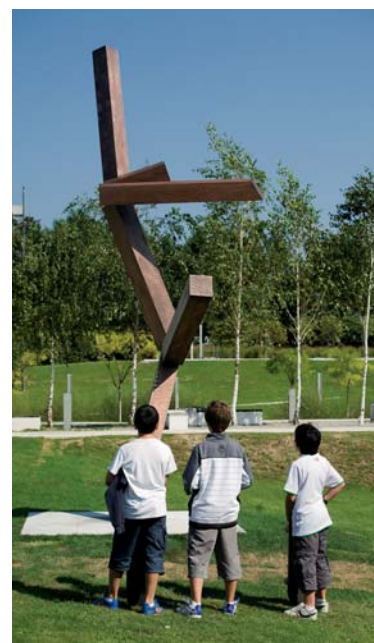
Niños contemplan la obra