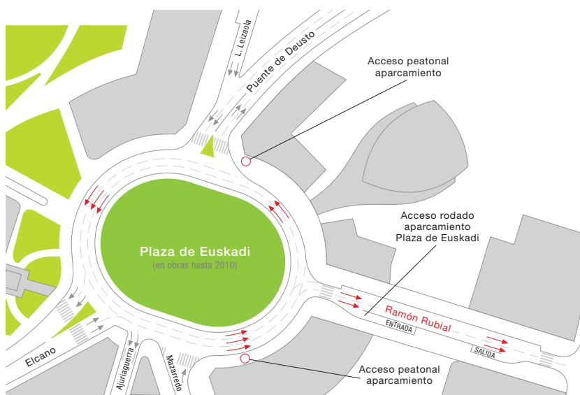
Esquema de los flujos circulatorios en la calle Ramón Rubial y la rotonda de la Plaza de Euskadi

Inaugurada la calle Ramón Rubial, que une la futura Plaza de Euskadi con Abandoibarra.