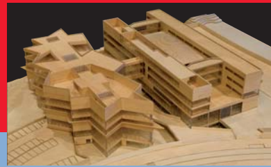
Edificio para Policía y Bomberos en Miribilla

Centro de Ocio y Cultura de La Alhóndiga Edificio para las instalaciones de Policía Municipal y Bomberos en Miribilla