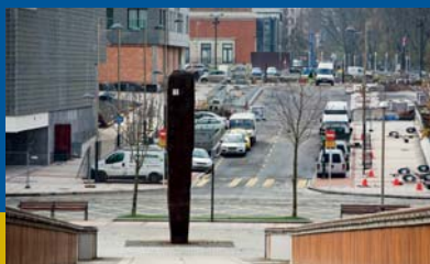
Calle Ramón Rubial