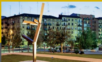
Obra de Shapiro en el parque de Lasasarre