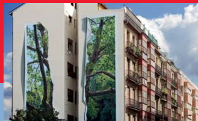
Medianera en San Francisco