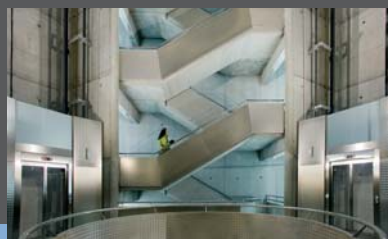
Estación de Miribilla

Reforma de la estación de Feve en La Concordia