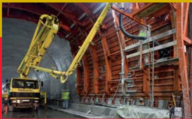
Soterramiento de la línea de Feve

Soterramiento de la línea de Feve en Basurto, Rekalde e Irala y nueva estación Hospital