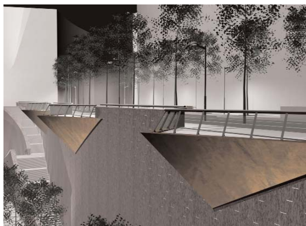
Vista nocturna de la futura Alameda de Mazarredo

Egitasmoak, Chollet/Izarvi/Albia UTEAk egin duenak, Mazarredo eta Abandoibarra, Ifas eraikinaren ondoan (Heros kalearekiko elkargunean), lotuko duten eskaileak jartzea aurririkusten du.