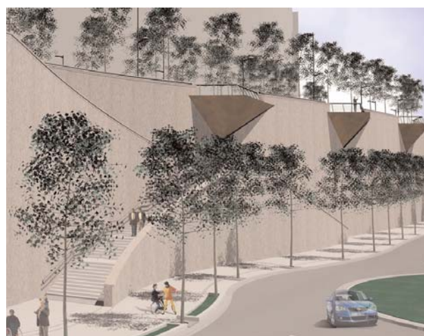
La zona recupera su carácter de paseo