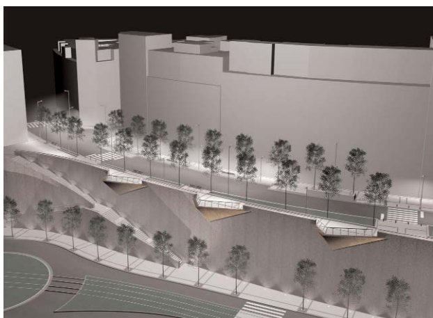
La entrada de coches al futuro aparcamiento se hará por Abandoibarra