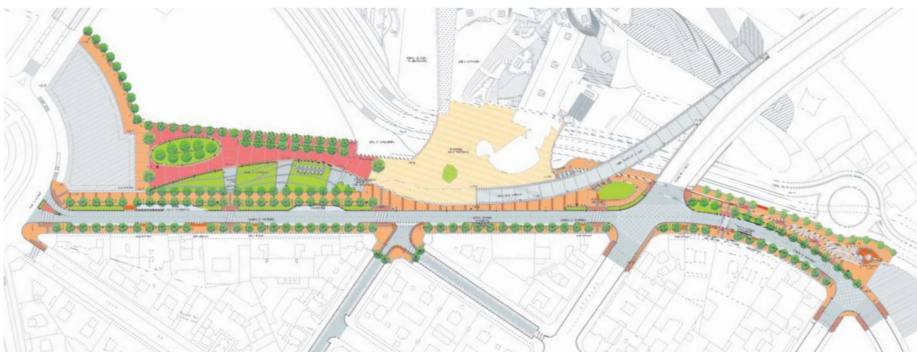
Plano general del proyecto de reurbanización de la Alameda de Mazarredo