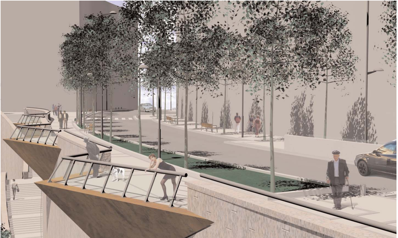
Varios miradores permitirán contemplar el entorno de la Ría

B ILBAO Ría 2000k urtarrilean hasi eta hogeita hamar bat hilabetez luzatuko diren lanak bukatzen direnean, Mazarredo Zumardia Abandoibarrera begiratuko duen bulebarrean bihurtuko da.