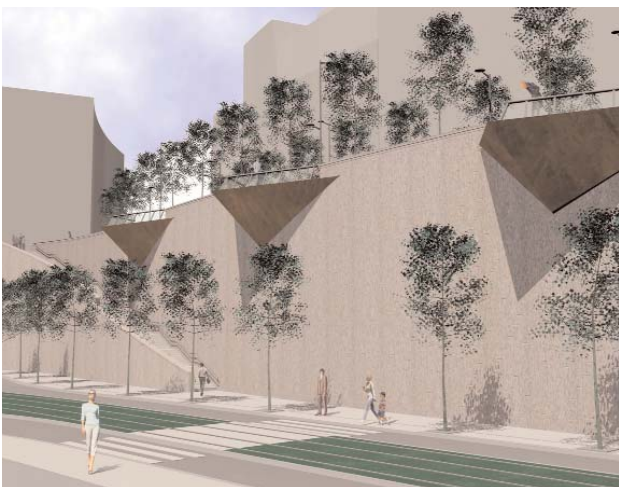
Mazarredo enlazará directamente con los alrededores del Guggenheim

Kaleak norabide bakoitzean karril bat mantenduko duenez gero, oinezkoak lan honen lehen onuradunak izango dira, espazio handiak eta Uribitarte eta Abandoibarrera begira egongo diren behatokiak izango dituztelako.